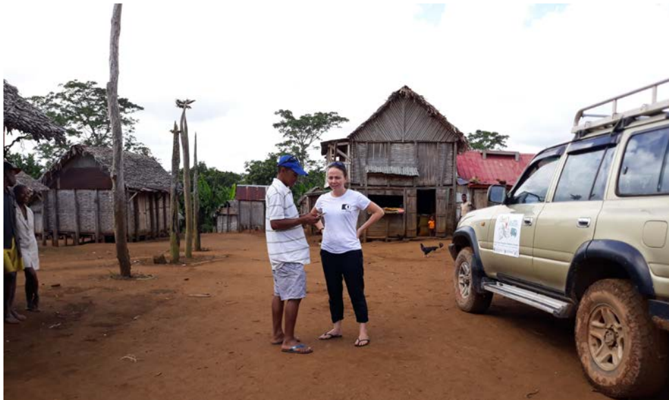
Mission de collecte de données et de formation à Madagascar, Mars 2018.

Evaluons ensemble la façon de mettre le talent et la créativité de vos collaborateurs au profit des causes humanitaires que nous soutenons.